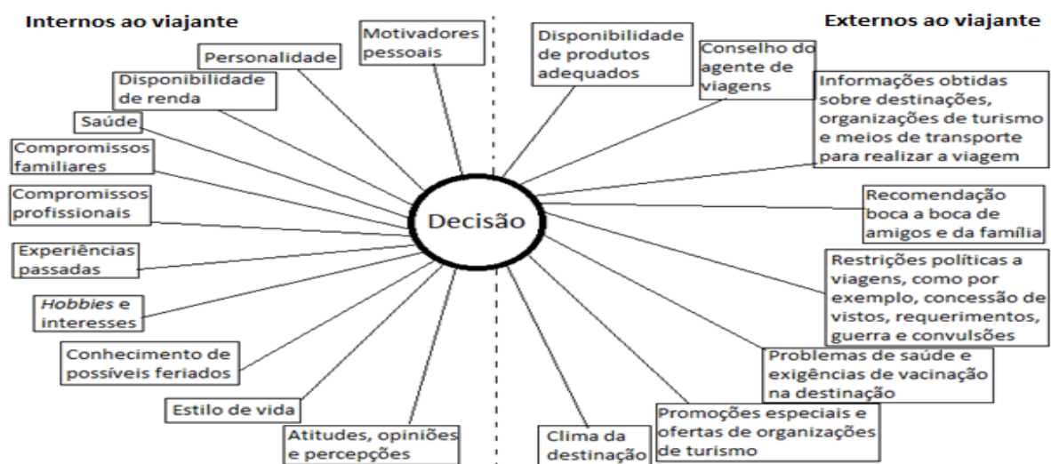
Figura 1 - Fatores que influenciam a decisão relativa às viagens.

Segundo Swarbrooke e Horner (2002, p. 113), o viajante está o tempo todo tomando decisões em sua viagem, sejam elas a respeito dos serviços de hospedagem, atividades locais de entretenimento, lugares para conhecer, restaurantes e transportes. Essas decisões possuem alguns fatores que as influenciam, em que, de acordo com os mesmos autores, existem os fatores internos e os externos conforme mostrado na Figura 1.