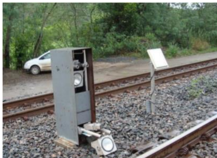
Figura 7 – Video Image.

Video Image significa vídeo e imagem, tem como função medir e avaliar os desgastes excessivos, a falta e a quebra nas sapatas de freios. Esse equipamento também informa outros danos do sistema de freio que contribuem para falhas durante a circulação dos vagões na ferrovia em pontos estratégicos, vide Figura 7.