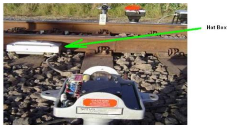
Figura 2 – Hot Box ou detector de roda quente.

O Hot Box , que significa rolamento quente, tem a função de detectar temperaturas elevadas nos rolamentos das rodas dos vagões durante a sua circulação na ferrovia em pontos estratégicos, e é mostrado na Figura 2.