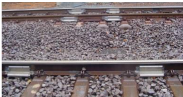
Figura 6 – TPD ou Truck Performance Dynamic .

O TPD, que significa performance dinâmica do truque, tem a função de medir e avaliar os desvios dos movimentos não esperados dos truques em cada trem durante a sua circulação. A Figura 6 apresenta esse equipamento.