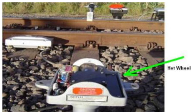
Figura 1 – Hot Wheel ou detector de roda quente.

O Hot Wheel , proveniente do inglês, significa roda quente, tem a função de detectar temperaturas elevadas nas rodas dos vagões durante a sua circulação na ferrovia em pontos estratégicos, e é apresentado de acordo com a Figura 1.