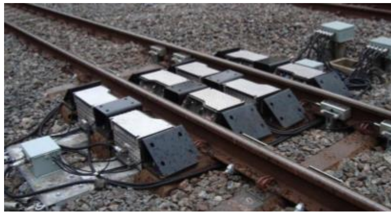
Figura 5 – Perfilômetro.

O perfilômetro tem por função medir os perfis dos frisos e bandagens das rodas ferroviárias durante a sua circulação. Esse equipamento é apresentado na Figura 5.