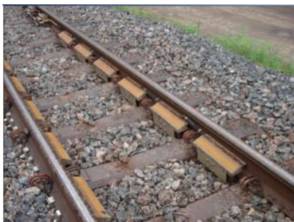
Figura 4 – Detector de impacto.

O detector de impacto tem a função de medir níveis de ruídos não conformes das rodas dos vagões durante a sua circulação na ferrovia. Verifica-se o equipamento na Figura 4.